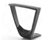
Coppia braccioli fissi TEKNO