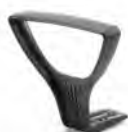
Coppia braccioli fissi GOLF