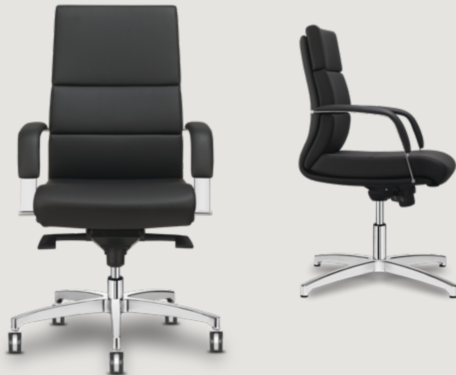
Body Manager - Meeting